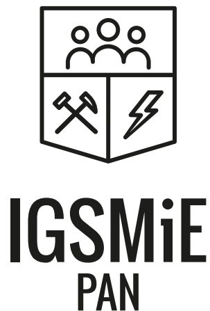
Logo wersja podstawowa - achromatyczna