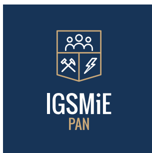
Logo na apli – kolorowe