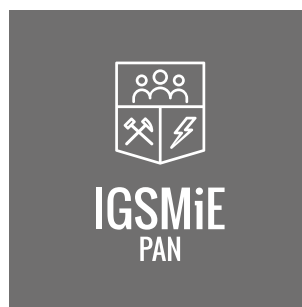
Logo na apli – achromatyczne