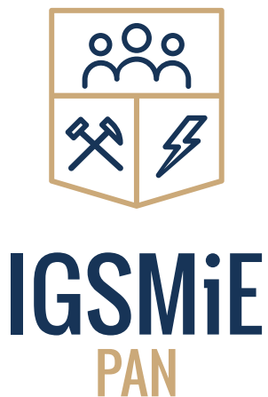
Logo wersja podstawowa - dwubarwna